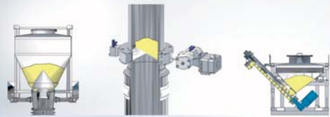
Entleer- und Dosiersystem mittels Kegel – Typ BPK für schwerfließende und klebrige Schüttgüter