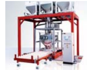
1. Vollautomatische, mobile Batch-Verwiegung 2. Auslass mit Dosierklappe