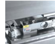
5. Entleerstation mit Wiegezellen 6. Containershuttle als Dosierwagen mit integrierter Waage