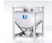
3. Schüttgutcontainer – Typ BPK 4. Schüttgutcontainer – Typ BP mit Absperklappe und Handrad