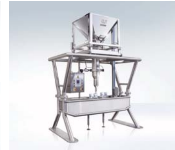
UCON Kleingebindeabfüllanlage für Endprodukte